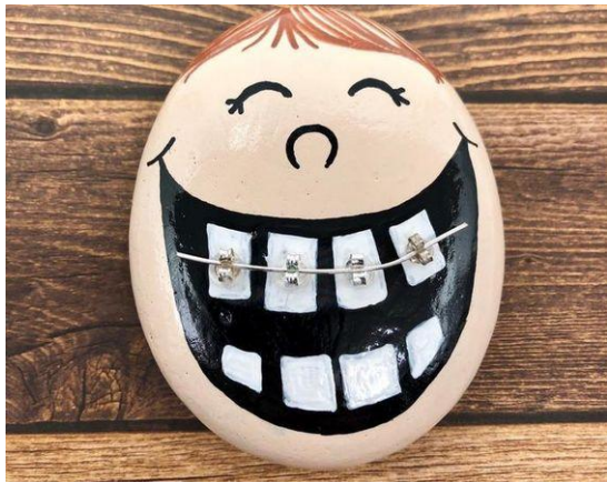
Erinnerung an - und Sicherung - der abgelegten Brackets