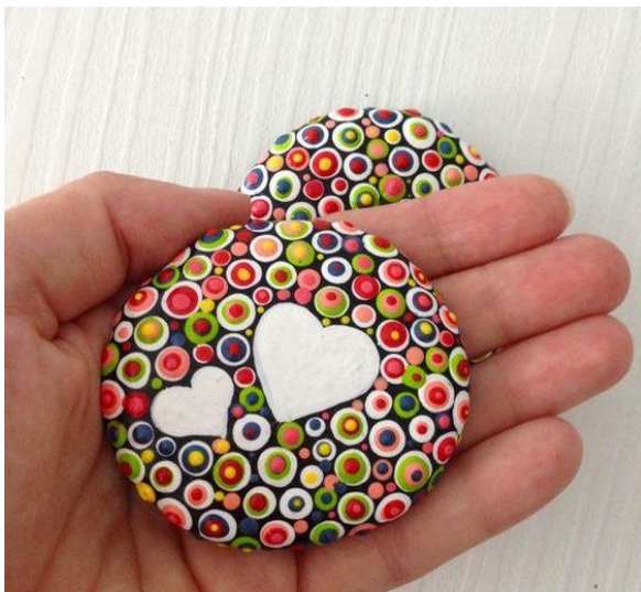
und noch ein paar andere Ideen . . .